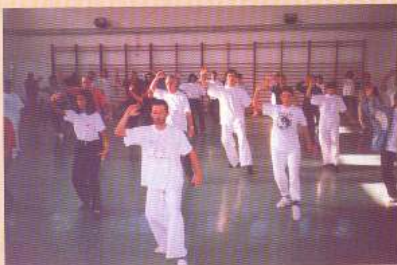
Un momento del entrenamiento de la forma de 108 movimientos