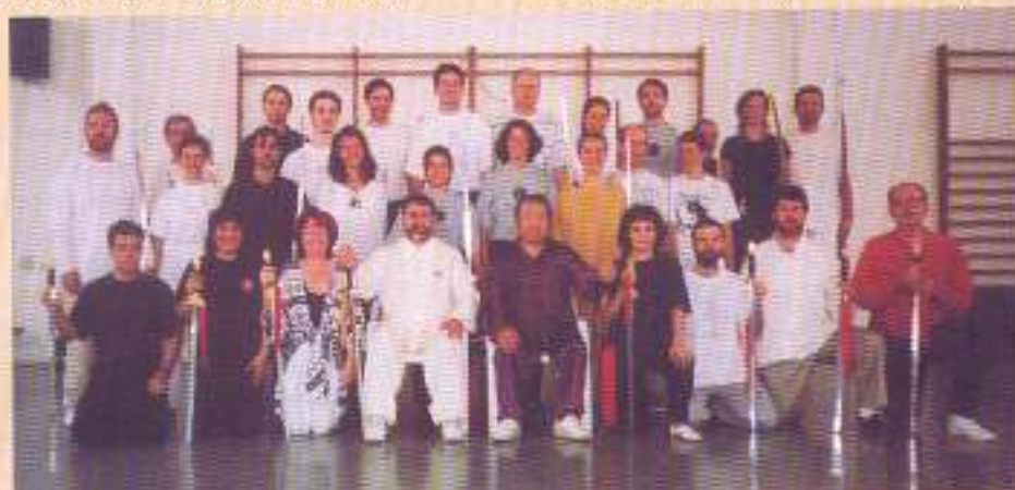
Componentes del grupo de trabajo con la espada